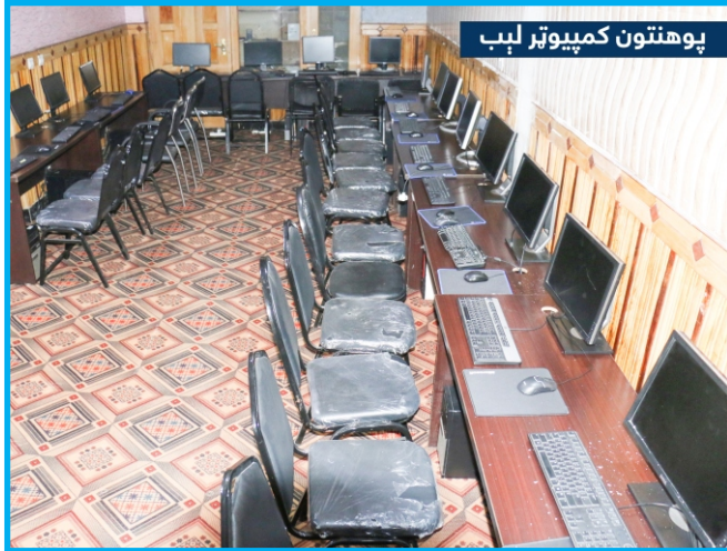
پوهنتون کمپیوٹر لېب